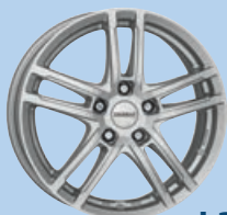
DEZENT TZ 15"-19"