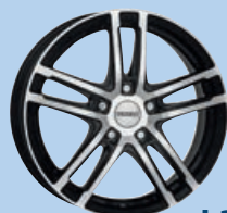
DEZENT TZ dark 15"-19"