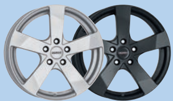
DEZENT TD/ TD dark 14"-19"