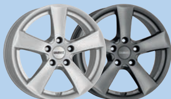
DEZENT TX/ TX graphite 14"-18"