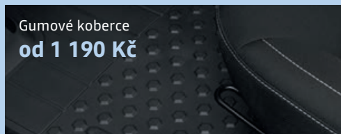
Gumové koberce od 1 190 Kč