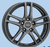
DEZENT TZ graphite 15"-19"